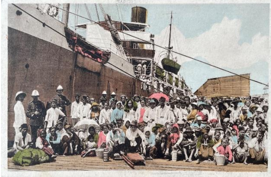
Aankomst Javaanse contractanten in Suriname (collectie Buku -Bibliotheca Surinama van Carl Haarnack)

Na de opheffing in 1863 van de slavernij in Suriname werd op de plantages contractarbeid ingevoerd. Tussen 1890 en 1930 vertrokken Javanen en Sumatranen naar Suriname als contractarbeider, daarna ook als zogenoemde vrije migranten. Hoewel ze van verschillende eilanden uit Nederlands-Indië afkomstig waren, werden ze stevast Javanen genoemd. De eerste 94 Javanen (62 mannen en 32 vrouwen) vonden werk op de suikerplantage Mariënburg aan de rivier de Commewijne. Met name in 1974-1975 en jaren daarna kwamen er duizenden Javanen naar Nederland. Ze verenigden zich in een stichting of comité.